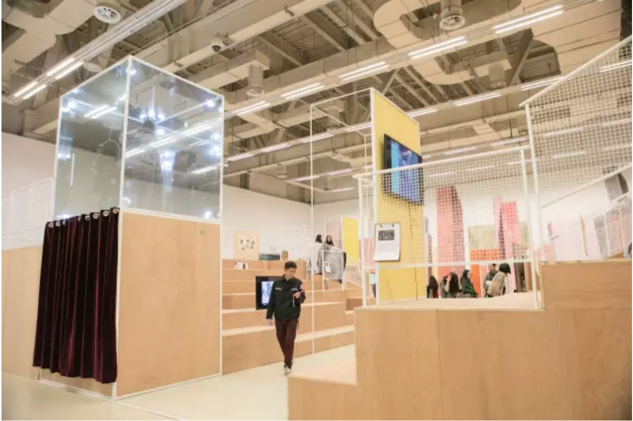
“展览的噩梦（下）”展厅现场

第一天到美术馆要进展场的时候，我到的早了，但东侧的警卫怎样也不肯认我的参展艺术家证件，即便我打电话让策展人和警卫沟通，还是不肯放行。楼上办公室承办人上班迟到了，没人能带我进去。于是决定改走另一个门，毫无迟疑地快步走过警卫前台，直接按了电梯按钮，警卫似乎犹豫了一下想叫我，但电梯门开了，我一脸漠然地按下关门键，成功上楼去了。